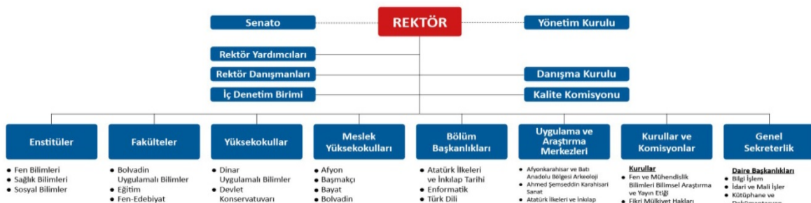
Tablo 9.1 Üniversite Organizasyon Şeması

Bölüm Kurul toplantılarında iç ve dış paydaşlardan alınan görüş ve öneriler dışında, bölüm öz görevleri, program öğretim amaçları, program çıktılarının belirlenmesi, öğretim planı (müfredat) ve içeriğinin oluşturulması, eğitim-öğretim kadrosunun belirlenmesi ve eğitim-öğretim altyapısının geliştirilmesi konuları görüşülmektedir. Bölüm kurulunda görüşülen konular ve alınan kararlar eğitim-öğretim faaliyetlerinin sürdürülmesinde önemli bir rol oynamaktadır. Ara sınav ve dönem sonu sınavları, bölüm kurul toplantıları, akademik kurul toplantıları, bölümdeki diğer komisyonların faaliyetleri, öğretim üyelerinin görüşleri ve dış paydaş görüşleri eğitim ve öğretimin sürdürülmesinde ve değerlendirilmesinde dikkate alınmaktadır. Bu kapsamda elde edilen bilgiler bölüm başkanlığı tarafından doğrudan değerlendirilmekle birlikte, aynı zamanda kalite komisyonu tarafından düzenli olarak analiz edilerek dönemlik, yıllık ve beş yıllık sonuçlar oluşturulmaktadır. Bölüm başkanlığının tespitleri ile bölüm kalite komisyonu raporları doğrultusunda gerekli durumlarda eğitim öğretim faaliyetlerinin sürdürülmesine yönelik düzeltici ve geliştirici önlemler alınmaktadır. Dinar Uygulamalı Bilimler Yüksekokulunun idari yapısını gösterir organizasyon şeması (tablo 9.1 ve 9.2), karar alma ve iş akış süreçlerini gösterir belgeler ekte sunulmuştur. Programa Özgü Ölçütler sağlanmalıdır.